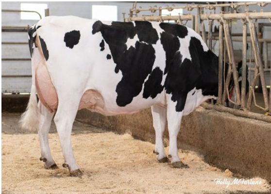
OCD LEGENDARY RAE DAM